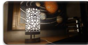
店内の雰囲気を壊さずに設置できます