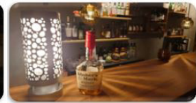
静音でお客様の会話を邪魔せずに設置できます