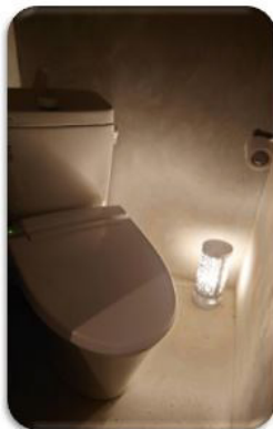
狭い場所でも邪魔せず消臭