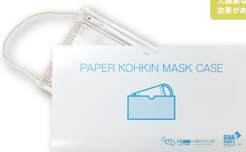
紙製抗菌マスクケース

抗菌効果は半永久的にあります。 抗菌効果は主に黄色ブドウ球菌や大腸菌などの菌の増殖を抑制する効果があります。